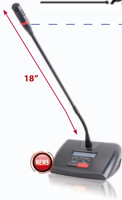
HT-2288C Code : 95-3040