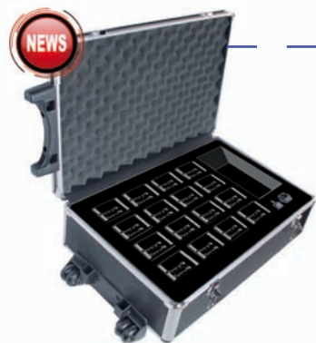
HT-2288B Code : 95-3042