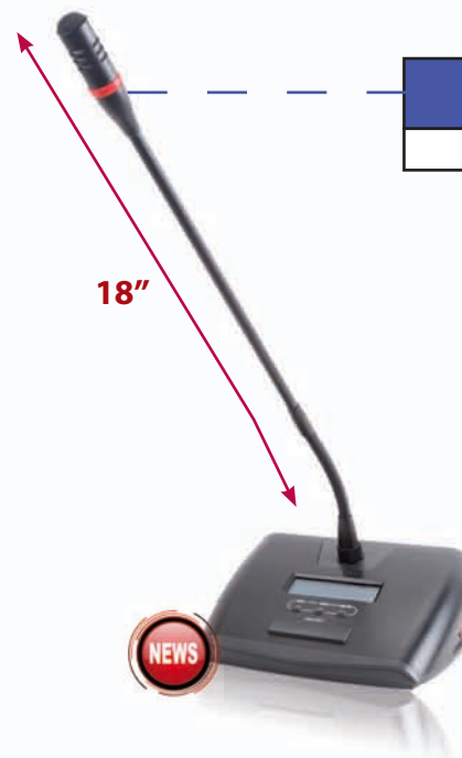
HT-2288D Code : 95-3041